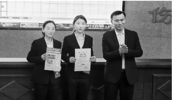
本报讯（通讯员 高碧林 黄君）市中心医院康复医学科参赛作品《我的面瘫康复之路》4月10日，“GZCPT全国康复科普大赛”在广州举行，襄阳市中心医院康复医学科荣获全国康复科普大赛一等奖。

本次大赛的主题是“康复科普，让看病少走弯路”，旨在以赛促建，提升专业技术服务能力，实现技术操作规范化、标准化、智能化、多样化，使服务具有及时性、有效性、安全性和满意度，不断提升专业技术水平和服务质量，改善人民生活品质。 比赛吸引了来自全国各地的康复从业人员及高校学生参加，共收到全国各地的有效投稿200余份。襄阳市中心医院康复医学科派出OT组参加本次大赛，经过数轮角逐路进最终决赛并荣获治疗组一等奖，同时在决赛作品的网络投票环节获得最佳人气奖，成为“双第一”获奖代表队。 获奖作品《我的面瘫康复之路》讲述了一位面瘫患者通过网络偏方尝试治疗而险些延误治疗的经过，后来及时醒悟到襄阳市中心医院康复医学科就医，痊愈出院。该作品真实反映了目前很多人由于缺乏医学知识，盲目相信偏方，“病后乱投医”导致延误治疗的现象。 襄阳市中心医院一直高度重视健康科普工作，康复医学科将会以此得奖为契机，以更加饱满的热情，推动康复健康科普宣传，不断提升专业技术水平和服务质量，改善人民生活品质，让民众正确看待“偏方”，看病少走弯路。