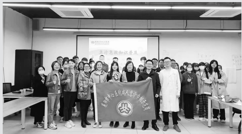
2021年4月21日下午,在襄阳华侨城儿童乐园即将开业之际,为确保儿童人身安全,提高华侨城员工的现场救治能力,襄阳市中心医院对外联络部组织急诊-重症医学科专家走进华侨城开展了一场精彩纷呈的应急救、救护知识培训。

堵与左束支起搏,以及心脏解剖异常的病人。3月26日,该科还在心腔内超声引导下进行肥厚梗阻型心肌病室间隔消融术。心腔内超声犹如“火眼金睛”,实时构建心腔内结构,精确还原复杂解剖,使医生在手术操作中能最大限度地避开敏感部位,避免手术并发症的发生,更安全有效,对孕妇妇女、儿童等特殊人群有极大的益处。襄阳市中心医院心脏电生理团队将继续探索新领域,为襄阳百姓带来更多优质、先进的医疗服务。